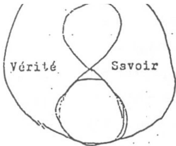
La bouteille de Klein